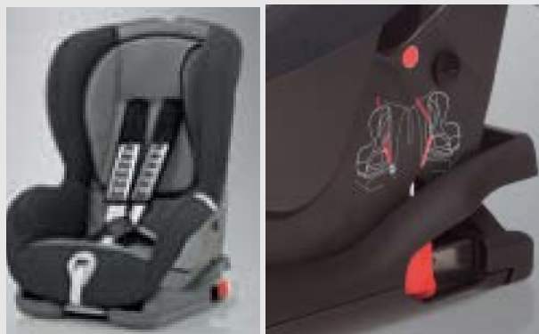
Автомобильное кресло Mitsubishi Duo Plus с ISOFIX (9-18 кг, 8 мес - 4 года) MZ313045B